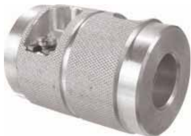
Zdzierak do rur Systemu KAN-therm PP