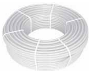
Rura PE-RT z osłoną antydyfuzyjną