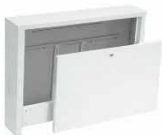
Szafka natynkowa do rozdzielaczy bez i z układem mieszającym