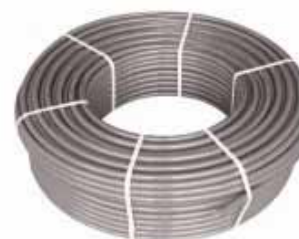
Rura wielowarstwowa Push Platinum