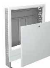
Szafka podtynkowa do rozdzielaczy bez i z układem mieszającym