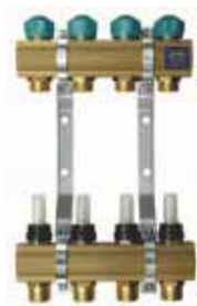
Rozdzielacz 1" z przepływomierzami i zaworami do siłowników, seria 75A