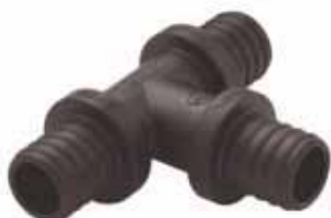
Trójnik Push PPSU