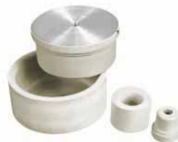
Końcówki do zgrzewania rur i kształtek Systemu KAN-therm PP