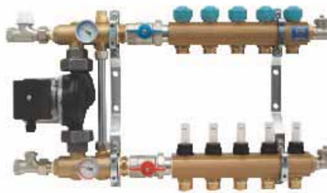
Rozdzielacz 1" z układem mieszającym, z przepływomierzami, seria 77A