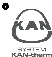
Rys. 7. PANTONE 425 C Rys. 8. C: 0 M: 0 Y: 0 K: 75

Znak firmy KAN może być również drukowany w ściśle określonych odcieniach szarości (w zależności od stosowanych mediów: (papiery powlekane i niepowlekane, papiery gazetowe). W przypadku konieczności użycia znaku firmy w publikacjach jednobarwnych zaleca się użycie PANTONE 425 C lub w przypadku druku triadowego koloru o składowych: C:00 M:00 Y:00 K:75.