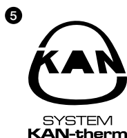
Rys. 5. Czerń 100% Rys. 6. C: 0 M: 0 Y: 0 K: 100

W określonych warunkami technicznymi przypadkach (fax, reprodukcje gazetowe) znak może być reprodukowany w100% czerni jak równieżwjej odpowiednikuwpostaci negatywowej.