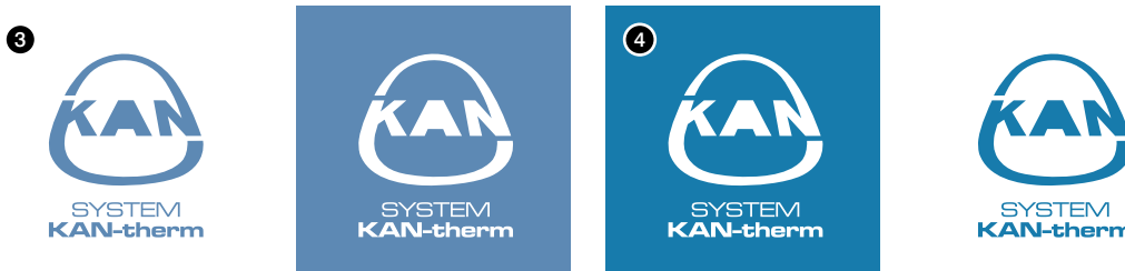
Rys. 3. PANTONE 646 Rys. 4. C: 75 M: 25 Y: 00 K: 25

Dopuszcza się również użycia znaku w formie negatywowej jednobarwnej z koniecznością użycia jako tła kolorów ze ściśle określonej tabeli kolorystycznej.